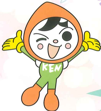
人権イメージキャラクター 人KEN まもる君